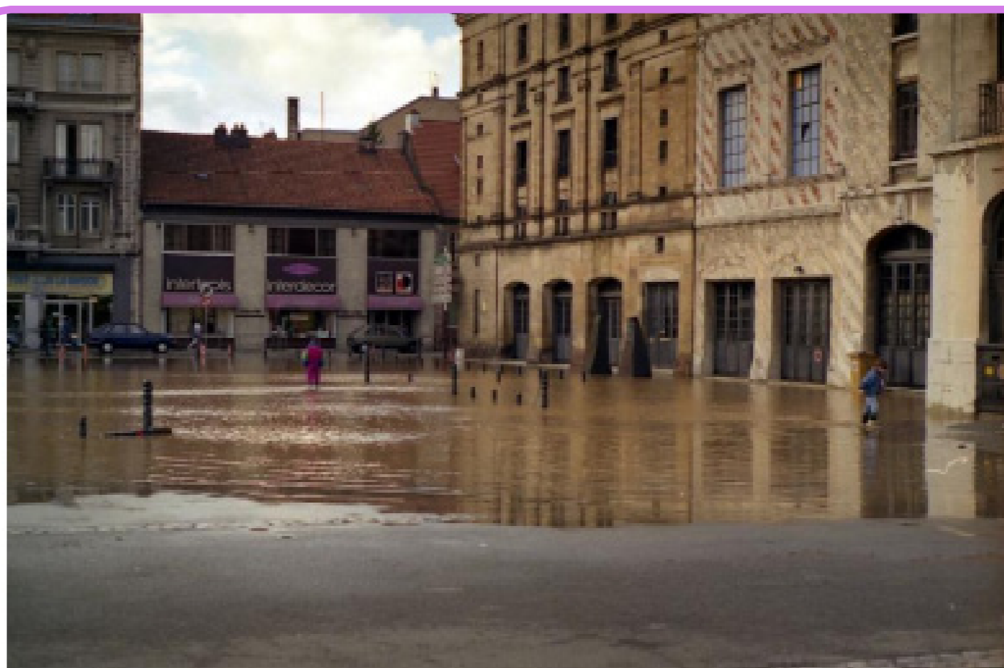
Photo de la crue de 1990: la place du théâtre était inondée, mais pas le faubourg de Montbéliard

Proposition de l'emprise de la zone inondable pour la crue de 1990 sur la place du théâtre à Belfort