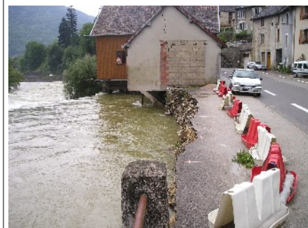
Érosion de berges à Lods (25) - 2006

Les berges s'érodant, elles sont alors sujettes aux glissements ou éboulements. Lors de glissements et éboulements brutaux, des vies humaines sont susceptibles d'être concernées. Les constructions peuvent être impactées dès lors que le phénomène de glissement ou d'éboulement se produit.