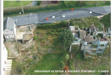
Conséquence d'un glissement de terrain (Calvados)

Du fait des fissures, des déformations et des déplacements en masse, les glissements peuvent entraîner des dégâts importants aux constructions. Dans certains cas, ils peuvent provoquer leur ruine complète (formation d'une niche d'arrachement d'ampleur plurimétrique, poussée des terres incompatible avec la résistance mécanique de la structure). L'expérience montre que les accidents de personnes dus aux glissements et coulées sont peu fréquents, mais possibles.